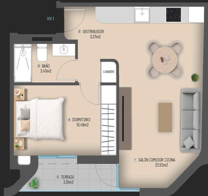
VIVIENDA ① PLANTA 1ª - 1 DORMITORIO