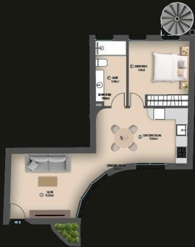
21 PLANTA ÁTICO - 1 DORMITORIO