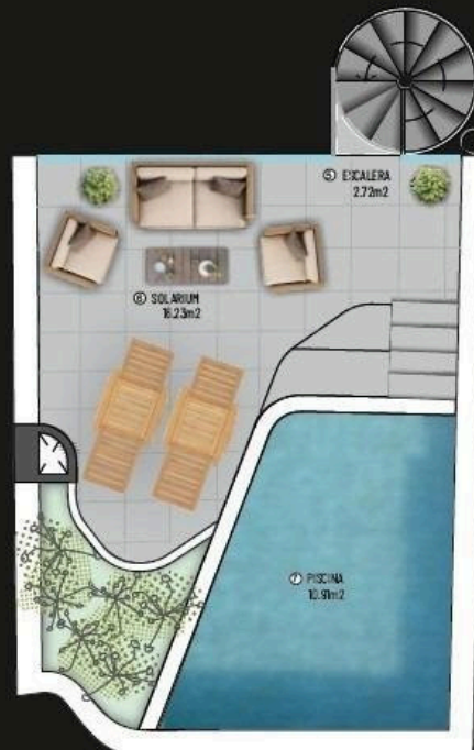
21 PLANTA ÁTICO - 1 DORMITORIO